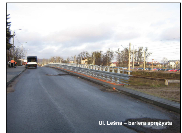
Ul. Leśna – bariera sprężysta