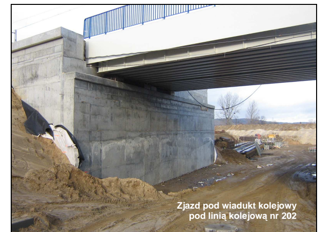
Zjazd pod wiadukt kolejowy pod linią kolejową nr 202