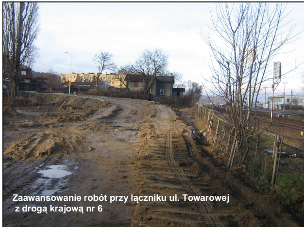
Zaawansowanie robót przy łączniku ul. Towarowej z drogą krajową nr 6