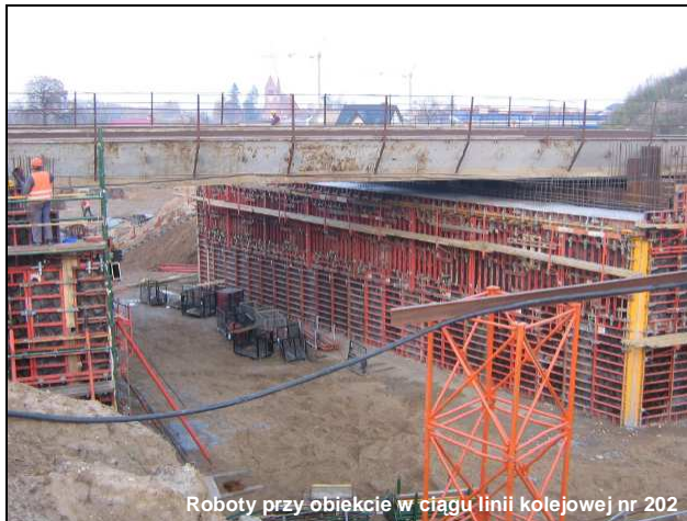
Roboty przy obiekcie w ciągu linii kolejowej nr 202