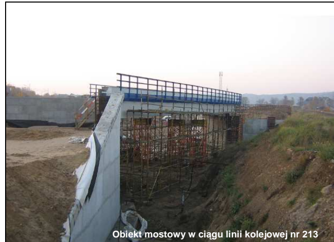
Obiekt mostowy w ciągu linii kolejowej nr 213