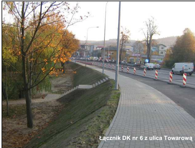
Łącznik DK nr 6 z ulica Towarową