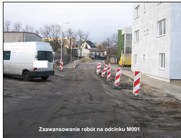
Zaawansowanie robót na odcinku M001