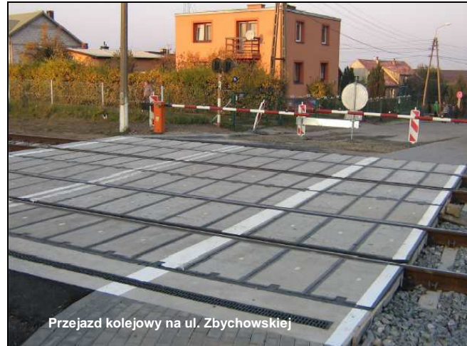
Przejazd kolejowy na ul. Zbychowskiej